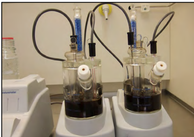
OLJEDUPPEDITTER: Dette er ikke en kjøkkenmiksmaster, men en maskin som måler vanninnholdet i oljen som blir pumpet opp fra havbunnen.

Han mener Fjell, Sund og Øygarden med rette kan kalles for teknokommunene i vest.